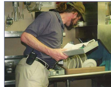
衛生檢查員檢查當地餐館，確保食品安全。

每 180 天檢查一次食品服務單位；調查食源性疾病報告；回應對食品服務單位的投訴；在臨時性食品服務設施為公眾提供服務之前對其進行檢查。請打電話報告食源性疾病或投訴餐館。