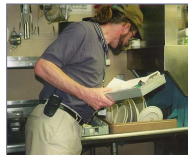
Un inspector sanitario examinando un restaurante para garantizar la seguridad de los alimentos.

Inspeccionar establecimientos de alimentos cada 180 días; investigar informes sobre enfermedades transmitidas por los alimentos; responder a quejas sobre establecimientos de servicio de alimentos; inspeccionar establecimientos de servicio temporal de alimentos antes de que sirvan alimentos al público general. Llámenos para reportar una enfermedad transmitida por alimentos o si tiene una queja sobre un restaurante.